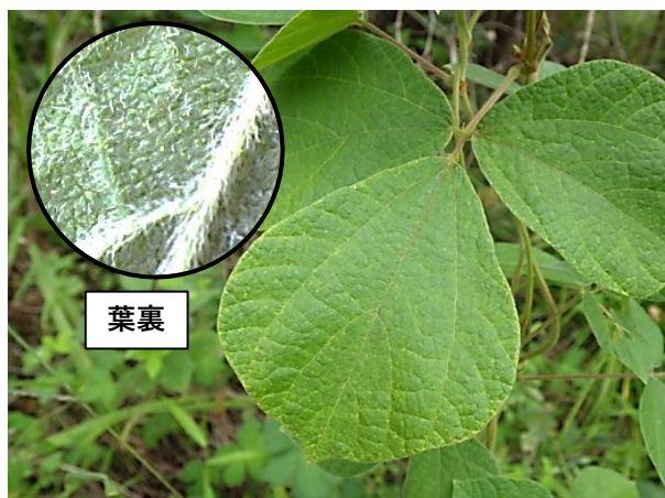
タンキリマメ:厚く丸みがあり、頂小葉の中央から先の幅が広い

この秋、奥多摩ゾーン湿性林エリアにタンキリマメが仲間入りしました。これまでトキリマメだけでしたので、ようやく、そっくりな2種を見比べていただくことができます。両者の違いを見分けるには葉が重要です。タンキリマメのほうがしわしわで分厚く、伏毛や腺点が多く、触ると少し独特の匂いがします。花だけだと、相違点はごく小さく、見分けるにはルーペが必要です。