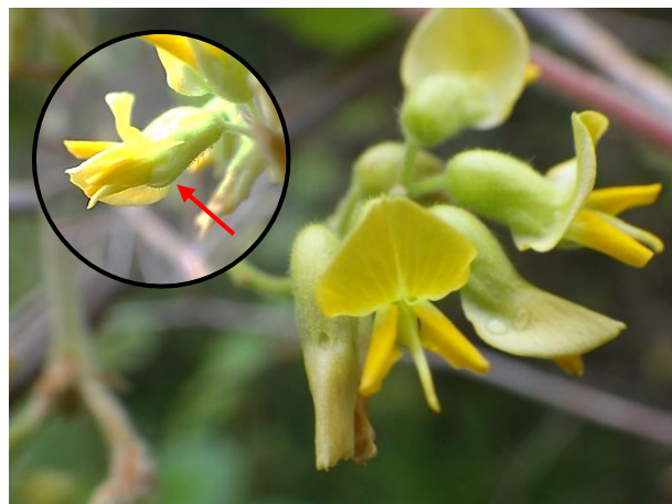
タンキリマメの花:最下のガク裂片は、ガク筒より長い