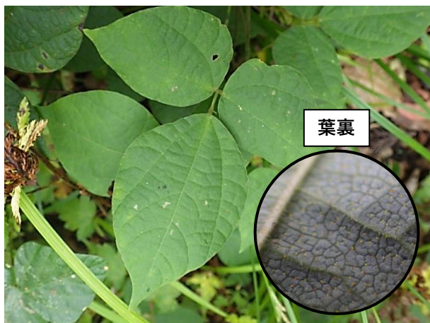
トキリマメ:小葉は先が尖り、頂小葉の幅は基部側が最大