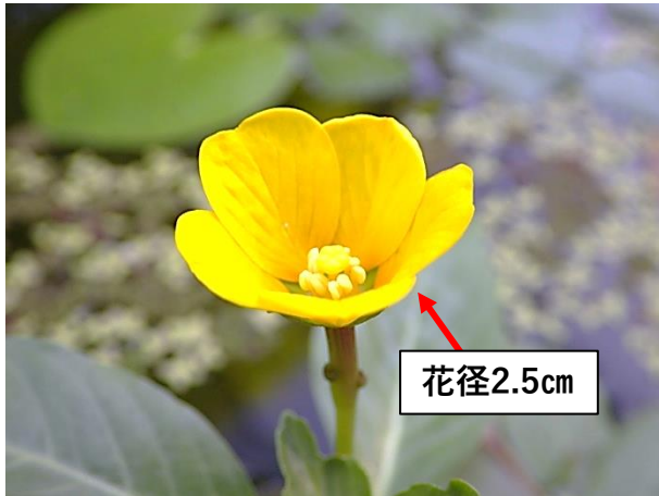
開花:5弁の放射相称花を咲かせ、柱頭、雄しべも5数性

ミズキンバイはアカバナ科の水生植物で、東京都では既に絶滅したと考えられています。4数性の多いアカバナ科には珍しく、5数性の花を咲かせ、通常の根とは別に長いスポンジ状の呼吸根を出します。ここまでは図鑑に載っています。ところが、よく見るとガク筒や葉柄基部に小さな突起までついています。いったい何のための器官なのでしょう？無性芽？花外蜜腺？それとも、、、謎です。