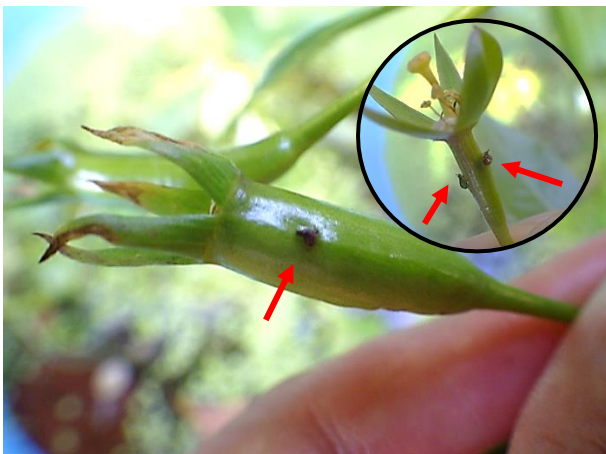
果実:肥大したガク筒と小さなカサブタのような1対の突起