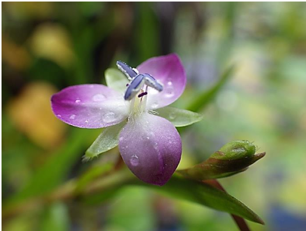
開放花: 赤紫色の花弁のイボクサの開放花(夏~秋)

今年は屋外水槽のイボクサがたくさん咲きました。イボクサは、ツユクサ科の1年草で冬には枯れてしまいます。すっかり草紅葉となった株のとなりに、青々とした茎を伸ばした株があります。茎の先には蕾のようなものまでつけています。あれれ、蕾にしては変です。よく見たらもう実が膨らんでいます。どうやら、訪花昆虫が少なくなったので、開放花から閉鎖花に切り替えて営業中のようなようです。