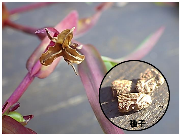
果実と種子: 開放花が熟して裂開した果実(12月初め)