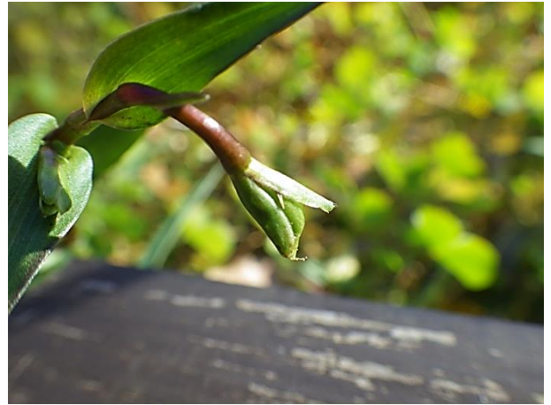
閉鎖花: 緑色の茎の先に花弁のない花をつける(12月初め)