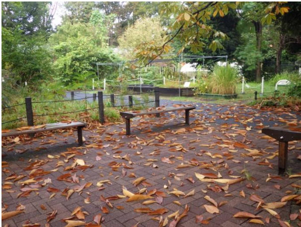
トチノキの落葉：毎朝地面やベンチの上にたくさん落ちている

学習園は落ち葉のシーズン幕開けです。毎朝たくさんの落ち葉が地面を埋めつくします。その中にはかつて複葉であった落ち葉もあります。例えば、情報館前の2本のトチノキ、手のひらのような掌状複葉をつけます。散ってしまうとバラバラで、いったいどれがどの葉かわからなくなります。でも、大丈夫、ちゃんと観察すると見分けがつきます。葉柄の上下も、側小葉の左右もわかりますよ。