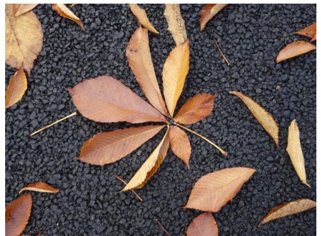
パズルの完成：全てつなげると、トチノキの葉のパズルができた