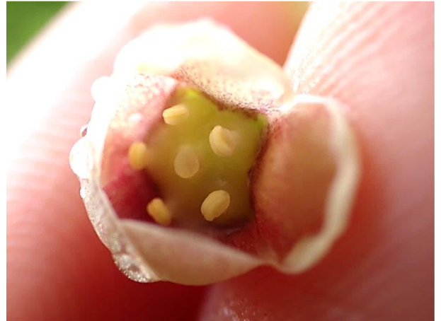
開き始め: 五角形の花盤の角に5つの黄色い葯が見える