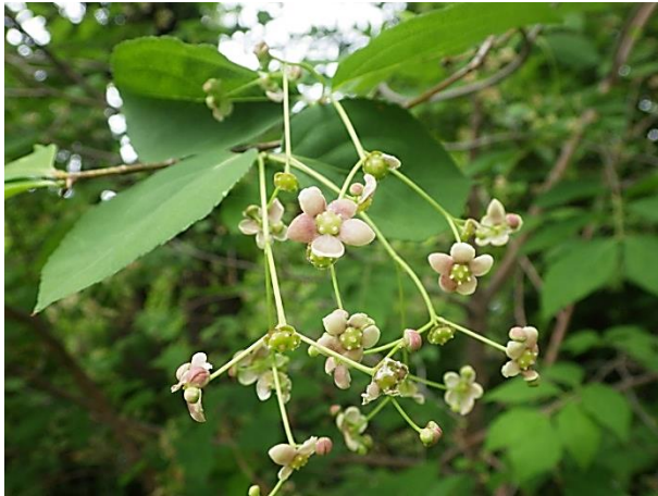
開花状況: 集散花序を下向きにつけ、次々に開花する

奥多摩ゾーン落葉広葉樹林エリアで、ニシキギ科の落葉低木、ツリバナが開花中です。ツリバナは4数性が多いニシキギ科の中で、花盤の発達した渋いピンク色の5数性の花を咲かせます。名前のように下向きに咲く平面的な花は、いったいどんな虫が花粉を運んでいるのでしょうか。花が終わると、長い果柄の先に球形の蒴果が膨らみ、秋には赤く色づき5つに裂開します。