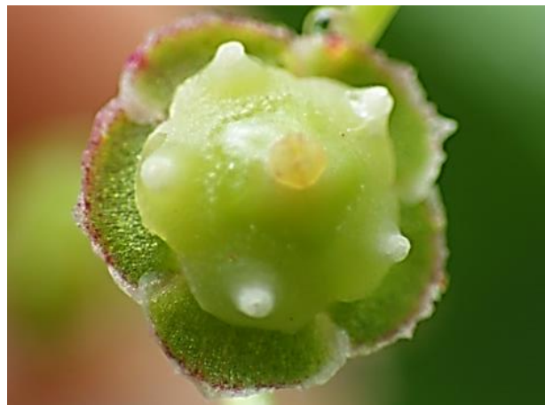
開花後: 花弁が散り、花盤の中央が五角形に盛り上がる