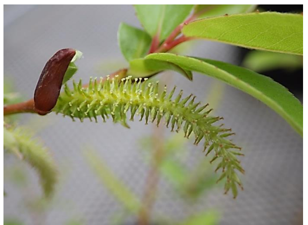
雌株の雌花序：基部から先端まですべて雌花がつく