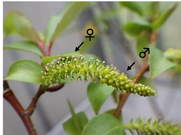
同じ雄株の別の花序：基部に雌花、先端に雄花のモザイク状