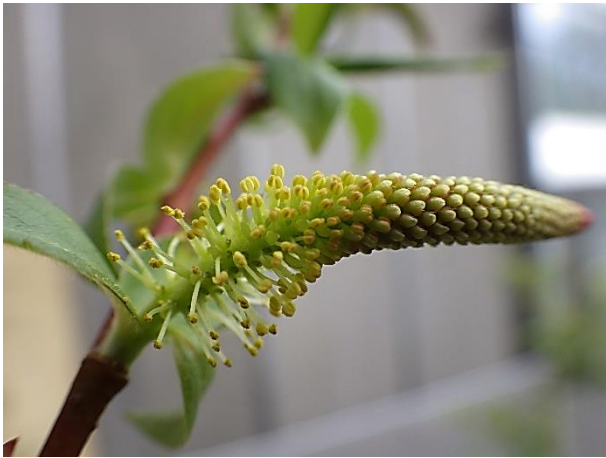
昨年の雄株の雄花序：基部から先端まで雄花のみがつく

植物多様性センターでは、丘陵地のシバヤナギを鉢で育成しています。昨年は雄株で正常な雄花序をつけた個体が、今年は雄花と雌花が混じった雌雄モザイクの花序をつけました。びっくりして専門家に伺ったところ、ヤナギの性転換はそれほど珍しくはないとのこと。「野外では同じ個体を継続して観察することは難しい。栽培下だからこそ観察できた現象ではないか」とのことでした。