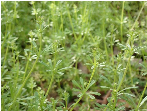
湿り気が多い空き地に群生する。

ヤエムグラはアカネ科ヤエムグラ属の冬型一年草です。ひよろひよろとした茎で頼りなさげにみえますが、茎と葉にあるトゲを周りのものに引っ掛けて体を支えて、どんどん上に伸びていきます。葉は6~8枚が輪生しているように見えますが、普通葉はその中の2枚で他は托葉です。2種類の葉を見た目で区別することはできませんが、腋芽の有無で普通葉を見分けることができます。よくみられる雑草ですが、学習園ではフクジュソウ園等でみることが出来ますよ。