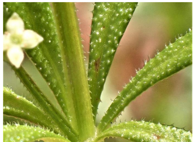
葉の縁と裏側の葉脈上、茎の稜には下向きの棘がある。