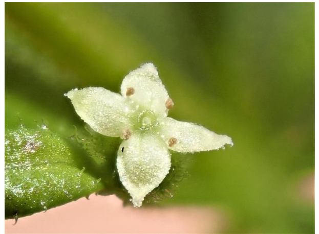
黄緑色で1mm程度の小さな花を咲かせる。