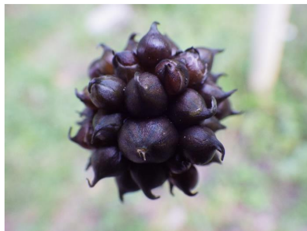
珠芽(ムカゴ)：5倍体とされる花がすべてムカゴとなった個体