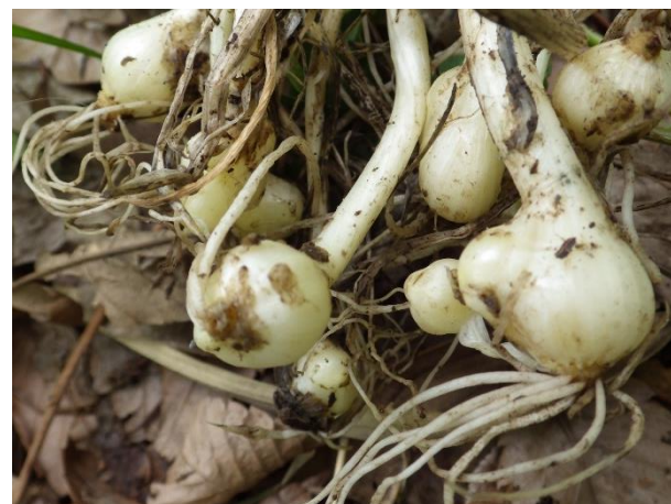
鱗茎：タマネギを小さくしたような鱗茎を地中につける