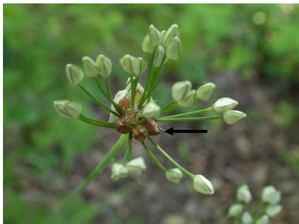
つぼみ：長い花柄の基部にはムカゴ(矢印)もついている

ノビルはネギの仲間の植物です。この時期白や薄紫の花を咲かせますが、中には花のかわりに紫色のぶつぶつしたムカゴをつけたものも見られます。じつは、ノビルには染色体が倍数化した個体が知られており、4倍体の個体では、受精せずに種子をつける無配生殖を行うとされています。種子を容易につけ、ムカゴや鱗茎でも増えることができるので、どこの草むらでもすぐに見つけることができるのですね。