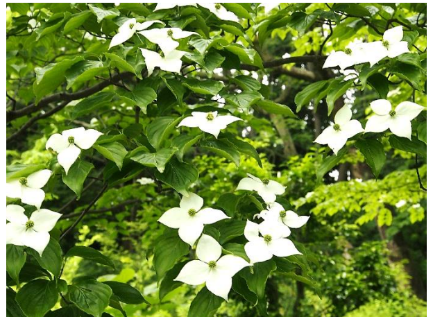
白いのは花弁ではなく 4枚の総苞片