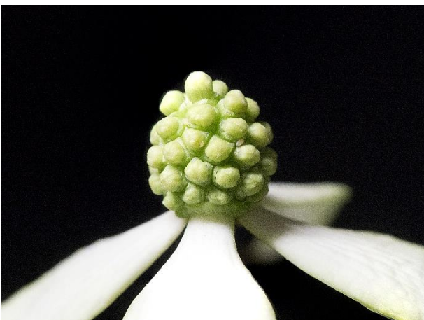
蕾、まだどの花も 開いていない