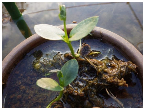
ゴキヅル:ウリ科らしい子葉から本葉を開き始めている