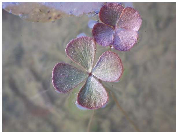
デンジソウ:展葉したばかりでまだ紫色を帯びている