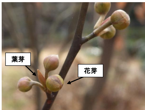
クロモジ雄株: 丸くて大きな花芽は雄花のはいつている冬芽