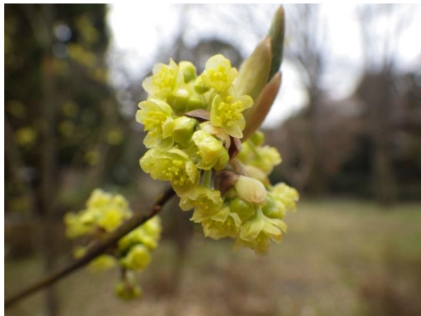
クロモジ雄花: たくさんのおしべがあり、花数は多い