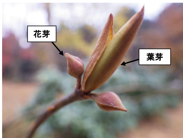
クロモジ雌株: 細くとがった花芽は雌花のはいつている冬芽

クロモジのように雌花と雄花を異なる株につける雌雄異株の植物は、花芽の大きさと性別を見分けることができます。雌花の入っている花芽は花数が少なく、とがった小ぶりな花芽となります。いっぽう雄花の入っている花芽は、花数が多く丸く大きな花芽となります。雌花は充実した種子をつけるため、少数精鋭に、雄花は遺伝子の多様性を維持するため、たくさんの花と花粉をつけるようです。花は3月末、ぜひ確かめてみてください。