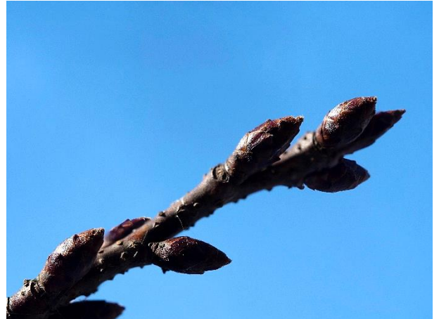
まだまだ咲く気配がない 横浜緋桜の蕾