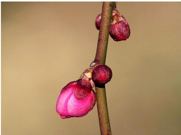
今にも咲きそうに膨らんだ 紅梅の蕾