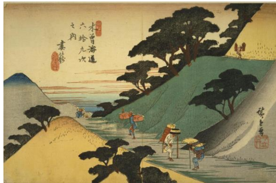
広重 『木曾海道六拾九次之内妻籠』 国立国会デジタルコレクション

江戸時代から残る小石川後楽園の園内は、江戸から木曾路、琵琶湖を通り、京都までの旅気分を味わっていただけるようにも造られています。