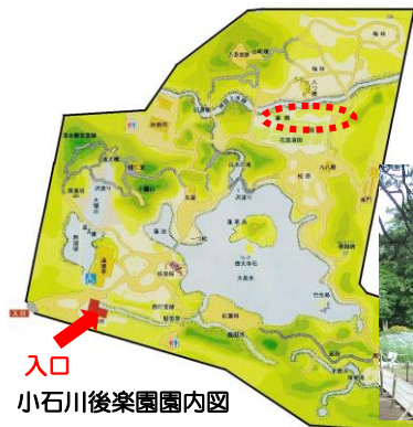
入口 小石川後楽園園内図

奥にある丘陵の曲線があるからこそ、すっきりと姿勢の良いハナショウブの艶やかさも引き立ちます。美術館で一双の屏風を鑑賞するように、ぜひ初夏の田園風景をお楽しみ下さい。