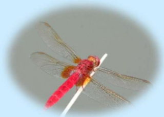
ショウジョウトンボ

いけ とねりこうえん かずおお 池のふち：舎人公園で数多くみられるコフキトンボやコシアキトンボは、ヨシやヒメガマが茂る水際でよく見られます。シオカラトンボも池のふちをよく飛んでいます。