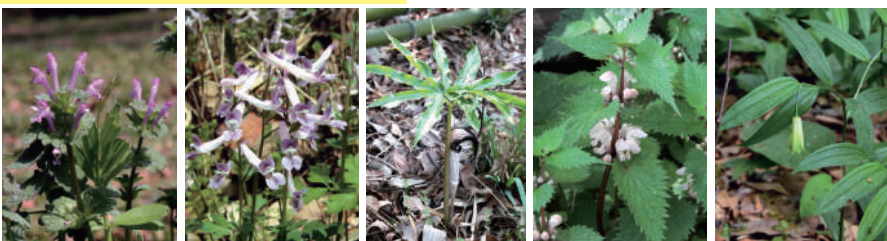
左から ホトケノザ、ジロボウエンゴサク、ウラシマンソウ、オドリコソウ、ホウチャクソウ

ヒメオドリコソウ、オオイヌノフグリ、ムラサキケマン、タチツボスミレ、ツボスミレ、タカオスミレ、ケキツネノボタン、タビラコの仲間、ハコベの仲間、タンポポが各種など多数