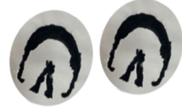
ミニホースの足あと