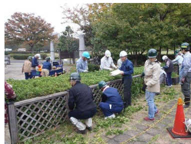
定員制講習(樹木)の様子

詳しくは、 公園協会ホームページ内ボランティアページの「TOPICS!」 に掲載しております。ぜひご覧下さい!(アクセス方法は裏頁に掲載しています)。