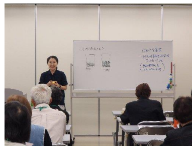
定員制講習(花壇・第 2 回)の様子