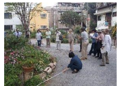
屋外での講習風景

最後に、ポピークラブで管理されている花壇は植栽の数が多くお花がいつも絶えなくて美しい一方、メンバーの負担も増えており、適切な量まで減らすためにはどうしたらよいかについても、意見を出し合いました。