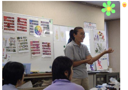
香山先生による講義

6 月に担当職員が花壇診断に伺い、花壇や団体の現状を把握した上で、講習のテーマを①三角花壇のデザインと管理 ②ボランティア団体の運営について ③土壌改良の方法(連作障害対策)、病害虫の防除について、に決定しました。