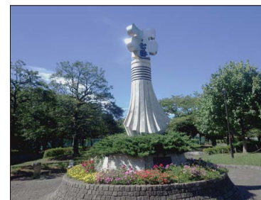
シンボルタワー「纏」 まとい

公園の中央にそびえるシンボルタワーは、江戸時代の火消人足組が高く掲げた「まとい」をイメージしたもの。都民の安全を表すシンボルとして、纏のモニュメントを建造しました。(現在、一般社団法人江戸消防記念会のもとに 11 区 87 組があり、この纏は 6 区 7 番組のものをもとにしています。)