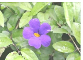
コダチヤハスカラス

南アフリカ原産。棘があり、赤い実をつける。花は白く良い香りがする。大神山公園内ではお祭り広場で見ることが出来る。