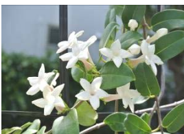
マダガスカルジャスミン

ヒガンバナ科の植物で、ハマオモト(ハマユウ)の近縁種。芳香のある、白く大きな花を咲かせる。葉もとても大きく、実もじゃがいもほどの大きさ。