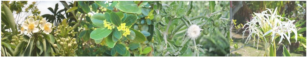
ムニンヒメツバキ