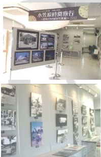
特別展「小笠原時間旅行」