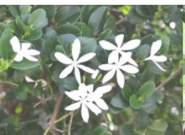
オオバナカリッサ

熱帯アメリカ原産。小さく、紫がかった白色の花を多数つける。実は熟すと真っ赤になり、宝石の赤珊瑚のように見えることから「数珠珊瑚」と名づけられた。