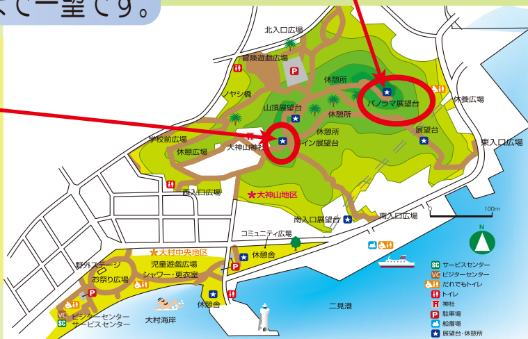
大神山公園 Map( ビジターセンターで配布しております )