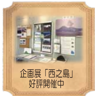
企画展「西之島」好評開催中