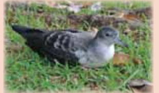
不時着うずくまってしまったオナガミスナギドリ

11 月に入り、ミスナギドリの巣立ちシーズンとなりました (12 月中旬頃まで)。ミスナギドリは光に集まる習性を持つため、町の光に近づき不時着してしまいます。不時着してしまった個体は交通事故やノネコに襲われやすいなど危険がいっぱい!! 簡単なレスキュー方法を学んで、うずくまっているミスナギドリを見つけたら、適切に野生に帰してあげましょう。