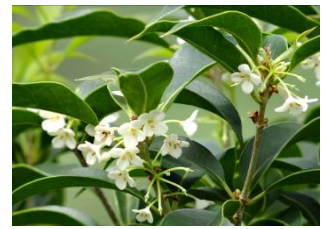
シマモクセイ (広) (大神山地区)

島名アレキサンドル。材が固いことからsax handle (斧の柄)と呼ばれていたのが転訛したもの。葉は楕円形で裏面には褐色の網状の脈が走っている。