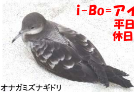
オナガミズナギドリ

i-Bo=アイボ 小笠原自然文化研究所 平日・昼間 04998-2-3779 休日&夜間 080-2035-8078