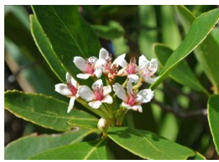
シャリンバイ (広) (大神山地区)

固有種でイネ科の多年草。内地のススキより少し小型で背丈は1mほど。戦前は家畜の飼料とされていた。大神山各所で見ることができる。