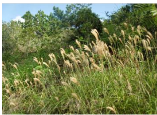
オガサワラススキ (固) (大神山地区)

固有種でイネ科の多年草。内地のススキより少し小型で背丈は1mほど。戦前は家畜の飼料とされていた。大神山各所で見ることができる。