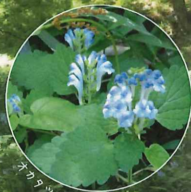
オカタツナミソウ

5月20日（土）平山城址公園で生き物共同調査を行いました。調査は環境省のモニタリング1000の調査方法を参考に、公園内を4つのルートに分けて園路沿いに進み、確認された植物を記録するというものです。今回は昨年10月に続き2回目の調査となります。