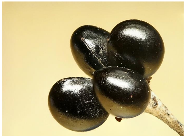
シロヤマブキの実 花が咲く頃にも付いている