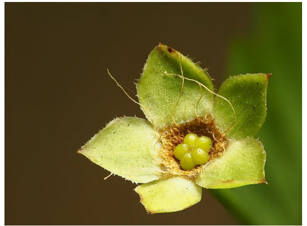
ヤマブキの花後 1～5個の分果が付く